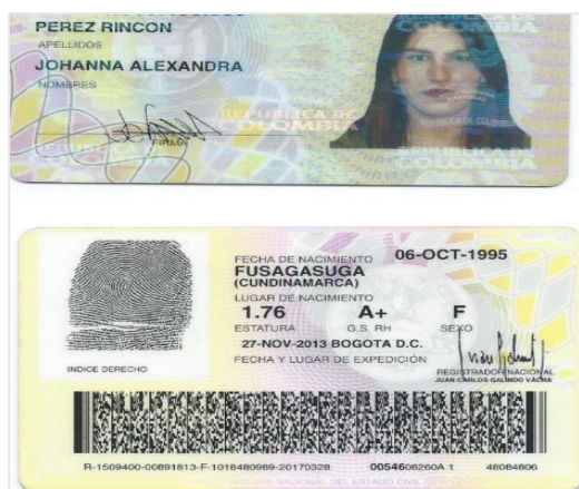
Figura 4.1. Nueva Cédula de Johanna después de la corrección