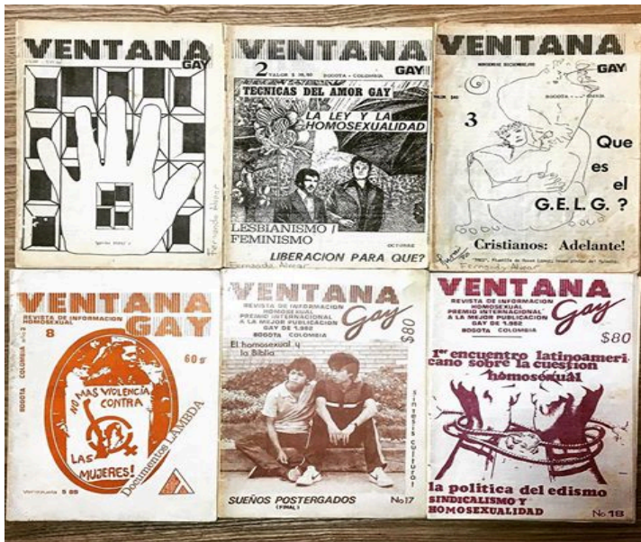
Figura 1.4. Portadas ediciones Revista Ventana Gay