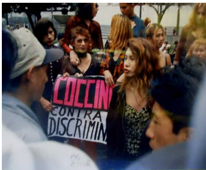
Figura 1.6. Primeras concentraciones en espacio público