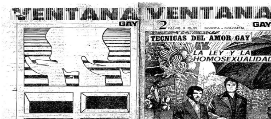
Figura 1.1. Portada Edición 2. Revista Ventana Gay