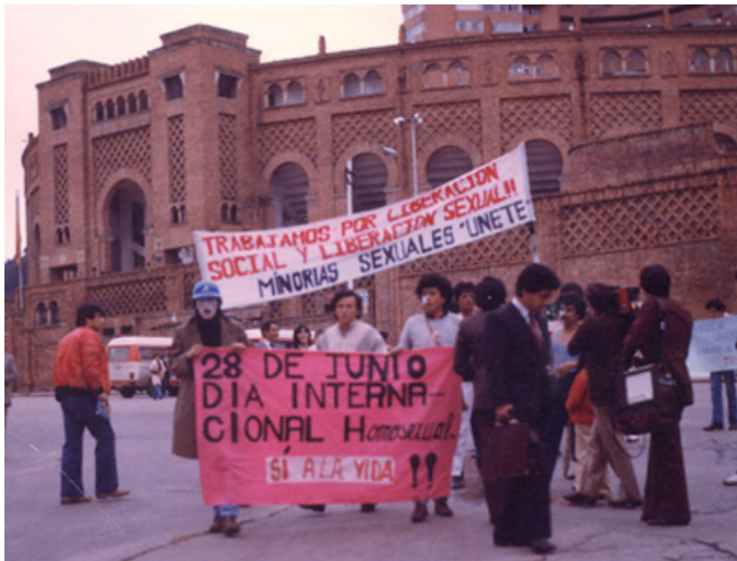
Figura 1.5. Primera marcha gay en Bogotá

Bogotá 1982